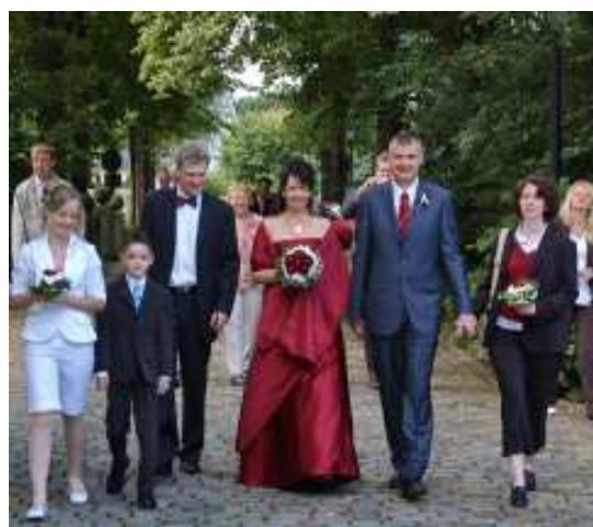
Ambiente für einzigartige Momente