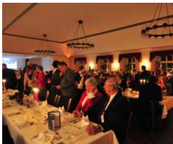
Der Stilvoller Ballsaal im Schloss Ovelgönne mit Bühne, Theken- und Buffetbereich

Im Schloss Ovelgönne Alles inklusive: 66,30 Euro p.P.